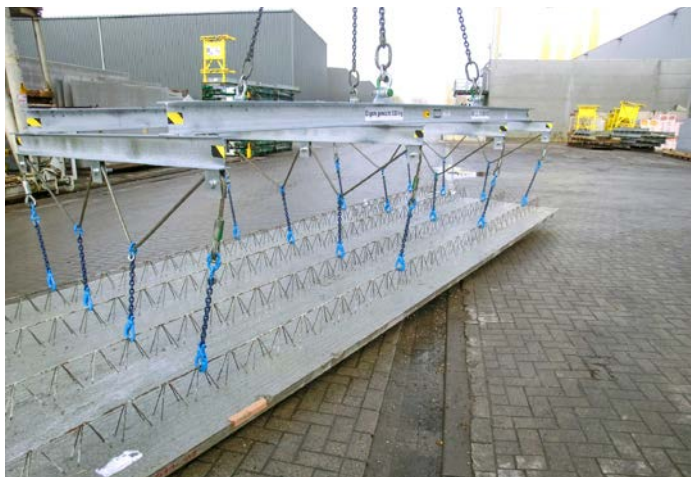
FIG. 5 - Hijsframe voor breedplaten

Het hijsen van breedplaten gebeurt altijd met hijskettingen en hijsshaken die bevestigd worden in de knooppunten van de tralieliggers. Afhankelijk van de lengte van de platen kunnen vier-, zes- of achtsprongkettingen gebruikt worden. De voorkeur gaat echter altijd uit naar het gebruik van een hijsbalk, ook evenaar genoemd, voor een betere lastenverdeling. Voor elementen langer dan 6,5 m moet hoe dan ook een hijsbalk of een speciaal hijsframe met hijskabels gebruikt worden (figuur 5).