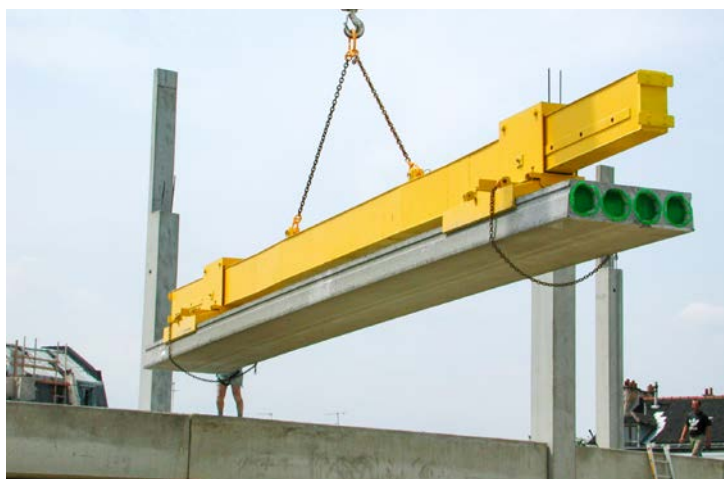
FIG. 6 - Welfselklem

element. Een te grote overkraging van het vloerelement tijdens de hijsbeweging kan namelijk leiden tot breuk. Ter info, veel welfsels hebben geen bovenwapening om trekspanningen op te vangen. De maximale overkragingslengte die opgegeven wordt door de fabrikant moet daarom altijd gerespecteerd worden. Dit geldt trouwens ook voor breedplaten. Verder moet de klem altijd symmetrisch ten opzichte van het zwaartepunt van het element geplaatst worden. Indien dit niet het geval is zal het element schuin komen te hangen. Een welfsel in een klem mag maximum 5° schuin hangen, anders kan het uit de klem vallen. Ook hijskettingen