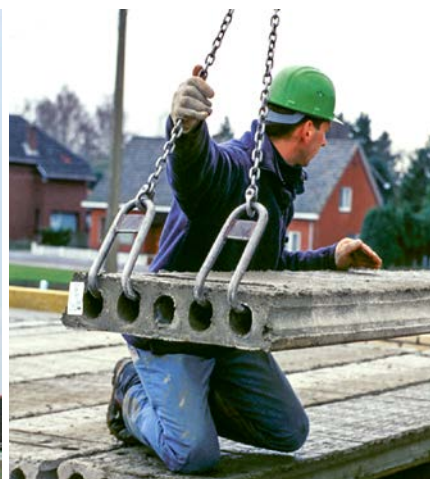
FIG. 7 - Welfselhaken