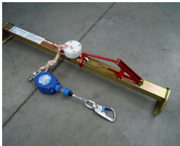
FIG. 4 - Valbeveiligingsklem voor welfsels (bron: High and Safe)