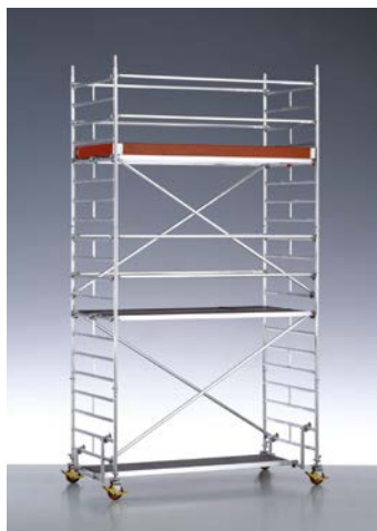
FIG. 3 - Rolsteiger

▶ Een schraagstelling is een andere optie die snel en eenvoudig kan opgesteld worden. Vandaar dat ook nogal eens gebruik gemaakt wordt van dit systeem. De grootste gevaren hierbij ontstaan wanneer de oversteek van de stellingplanken of de afstand tussen de schragen te groot is en wanneer de stelling verhoogd wordt met een tweede niveau schragen. Verder is de toegang tot de schraagstellingen niet altijd even veilig en zijn ze meestal niet uitgerust met een leuning. Bij werken op schraagstellingen mag ook niet uit het oog verloren worden dat de leuningen die in de vensteropeningen zijn geplaatst niet voldoen als valbeveiliging.