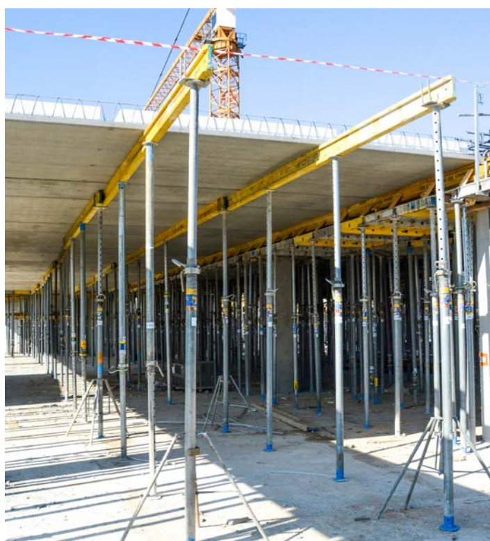
FIG. 2 - Etais sur trépied

➤ parfois lorsque l'élément est trop long ou lorsque le détaillage de la construction d'appui ne tient pas compte de la méthode de pose, ou inversement. Par exemple, lorsque l'armature sortante d'un élément de plancher ne peut pas être glissée sous l'armature d'une poutre par manque de place à l'autre extrémité. (figure 1). Pendant l'éventuel forçement de l'élément, naît le risque que la poutre de soutien soit poussée vers l'extérieur et que l'élément 'trop court' n'ait plus d'appui, avec sa chute ou son endommagement comme résultat. Le risque de chute ou de dommages est beaucoup moins important avec des éléments de plancher sans armature sortante, parce que l'appui nominal est toujours plus grand. Des situations dangereuses peuvent toutefois se présenter lorsqu'un élément est trop long et doit être forcé entre la structure portante. Il est préférable, pour cette raison, de ne pas essayer de poser des