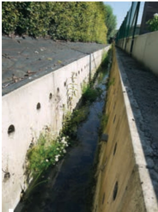
De door Martens beton ontworpen grachtelementen. Een belangrijke ontwerp eis was ook het 60cm brede bodemoppervlak, zodat de grachten machinaal kunnen schoongemaakt worden. Les éléments de drainage développés par Martens béton. Les canaux devaient absolument faire 60 cm de large, afin de pouvoir être nettoyés manuellement.